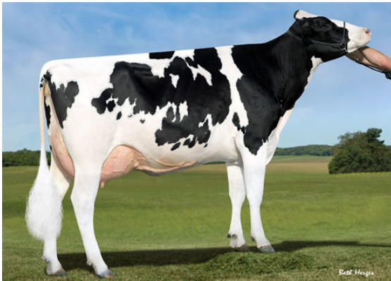
SANDY-VALLEY MORGAN ERA FOURTH DAM